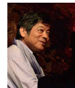
大原 保人 Photographer Miho Chihaya

ベイサイドジャズ2021千葉のPRイベントを行います。 派手でかつよくてモダンなサウンドをお楽しみください。