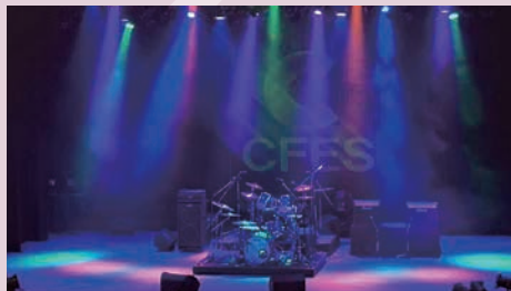
会場(千葉市文化センター)

CFESのCとは? CHIBA(千葉) CHANCE(機会) CULTURE(文化) CREATIVE(創造) CHALLENGE(挑戦)